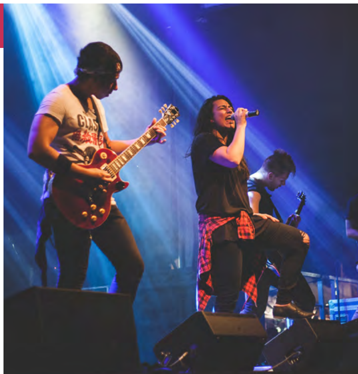
Entrée libre - 19h30 : Apéritif partagé (chacun amène un petit quelque chose à manger ou à boire) 20h30 : Début des passages

Artistes, pensez à réserver votre passage sur les planches au 04 67 02 99 42 ou animation@mjc-castelnau.fr